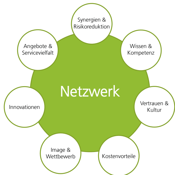
Vorteile von Netzwerken nach Nutzenkategorien

Die Vorteile von Netzwerken lassen sich in folgenden Nutzenkategorien beschreiben: